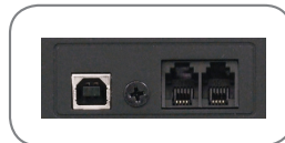
port RJ-11 port USB