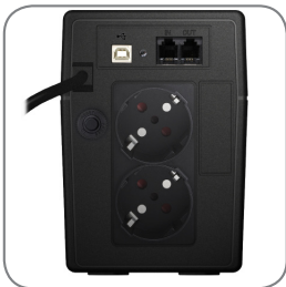
MCL- 655SSU AVR LCD 2XSCHUSB symbol prod. 1966008497